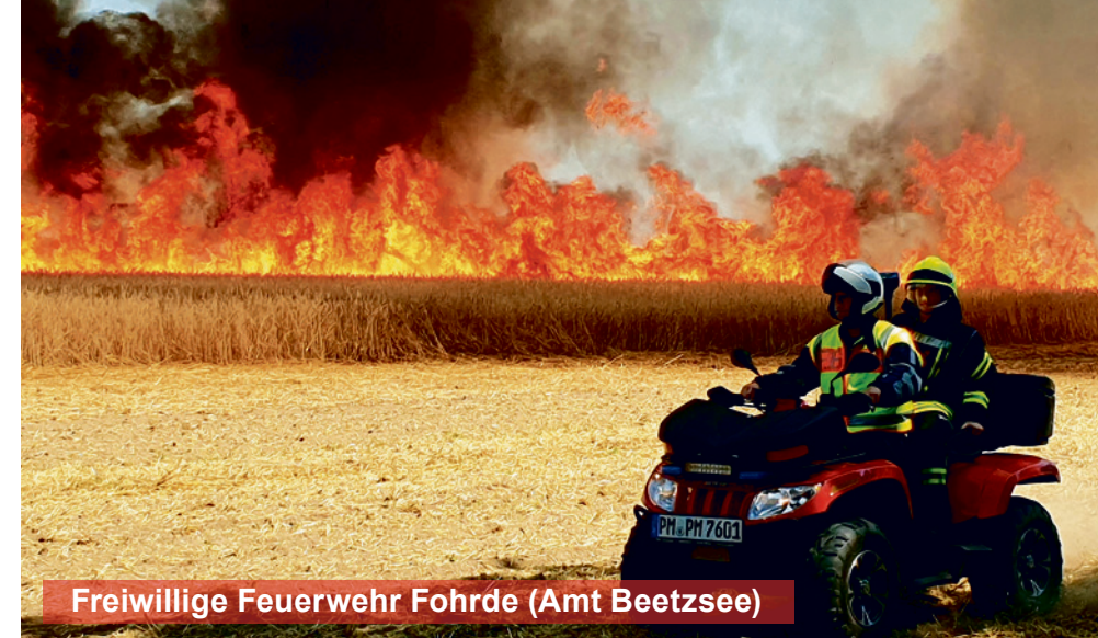
Freiwillige Feuerwehr Fohrde (Amt Beetzsee)