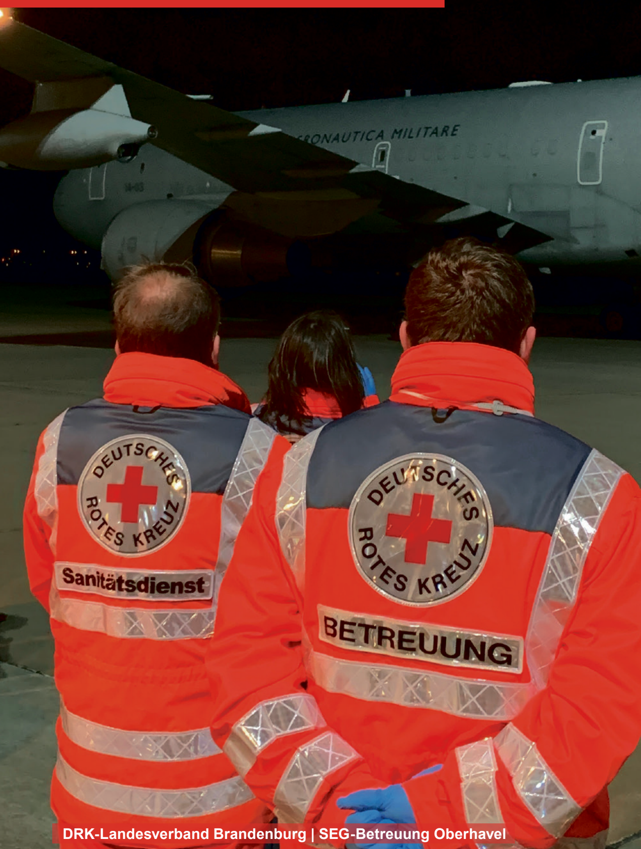
DRK-Landesverband Brandenburg | SEG-Betreuung Oberhavel