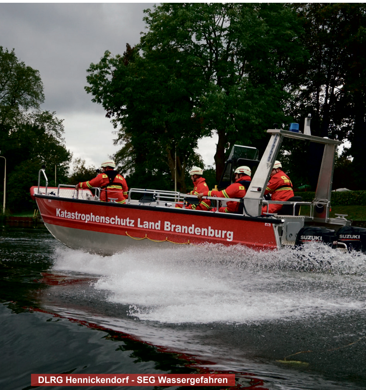
DLRG Hennickendorf - SEG Wassergefahren