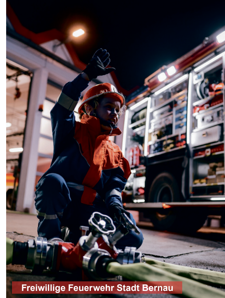
Freiwillige Feuerwehr Stadt Bernau