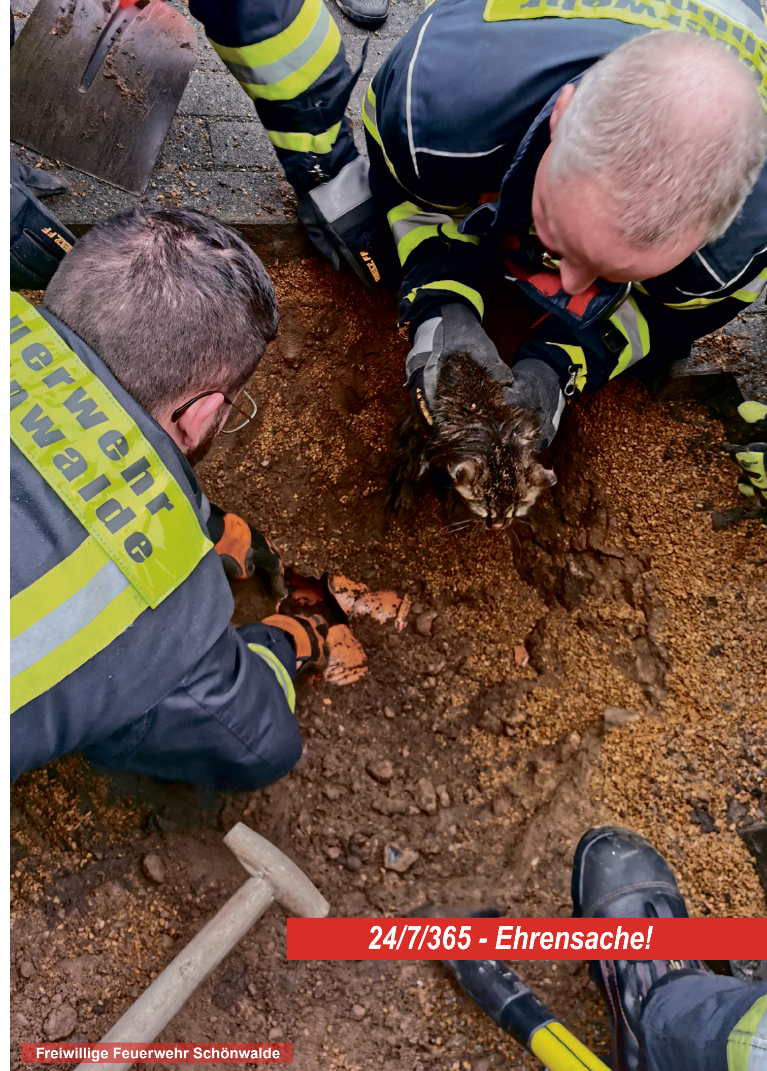
24/7/365 - Ehrensache!