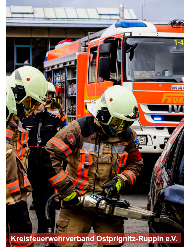
Kreisfeuerwehrverband Ostprignitz-Ruppin e.V.