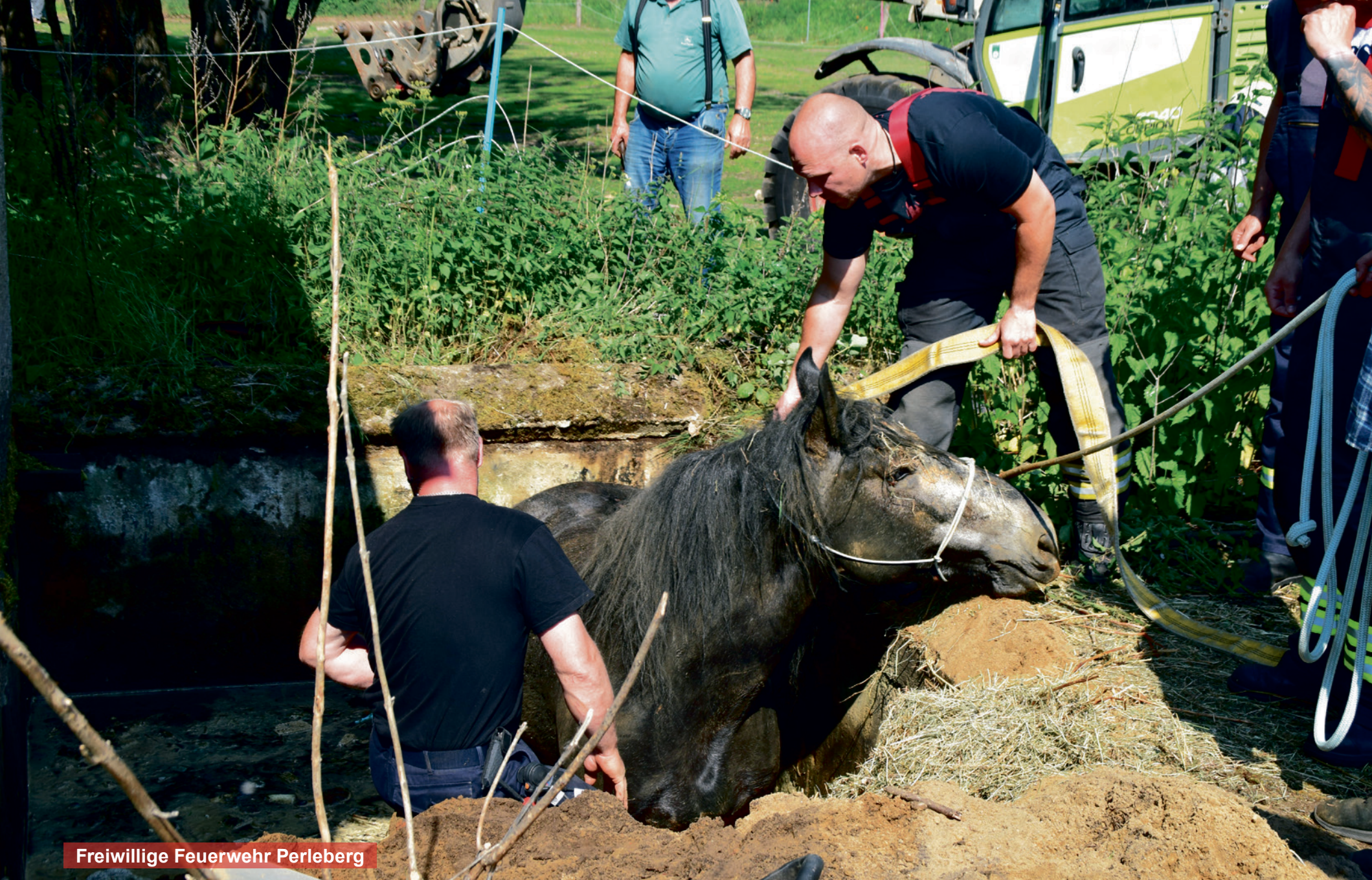
Freiwillige Feuerwehr Perleberg