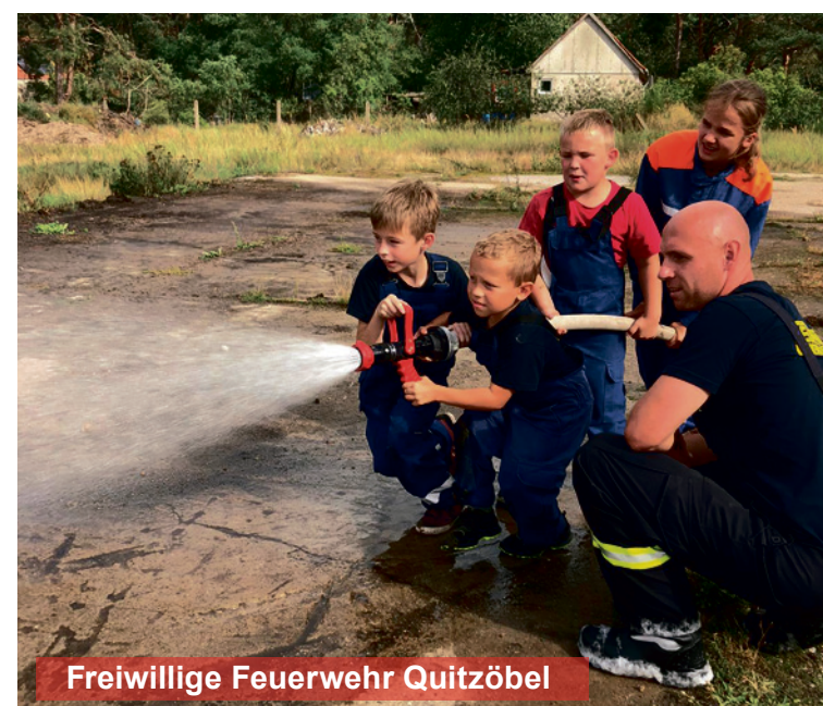
Freiwillige Feuerwehr Quitzöbel