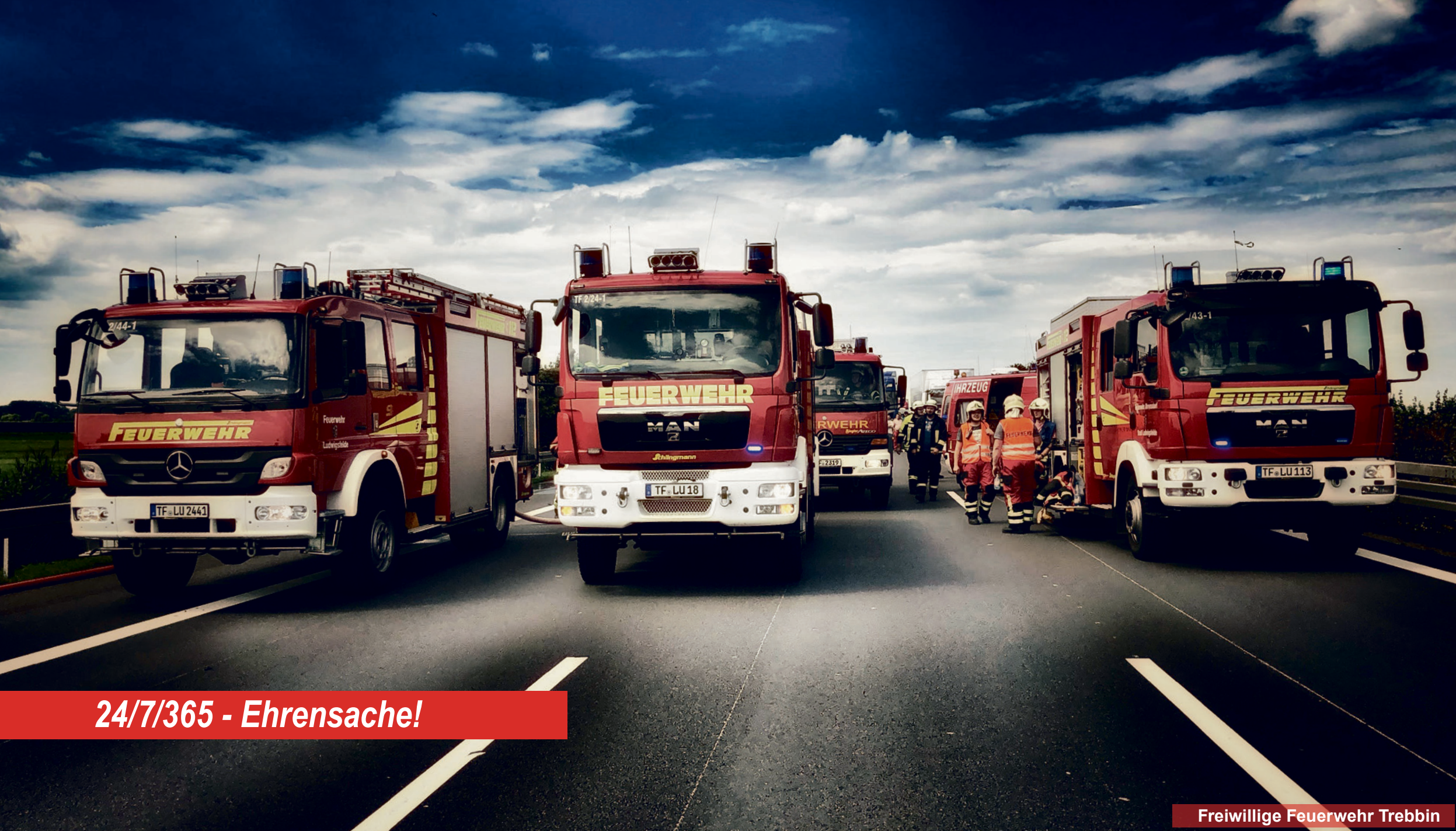
24/7/365 - Ehrensache!