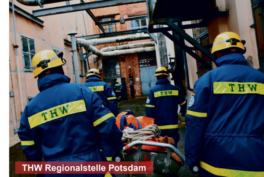
THW Regionalstelle Potsdam