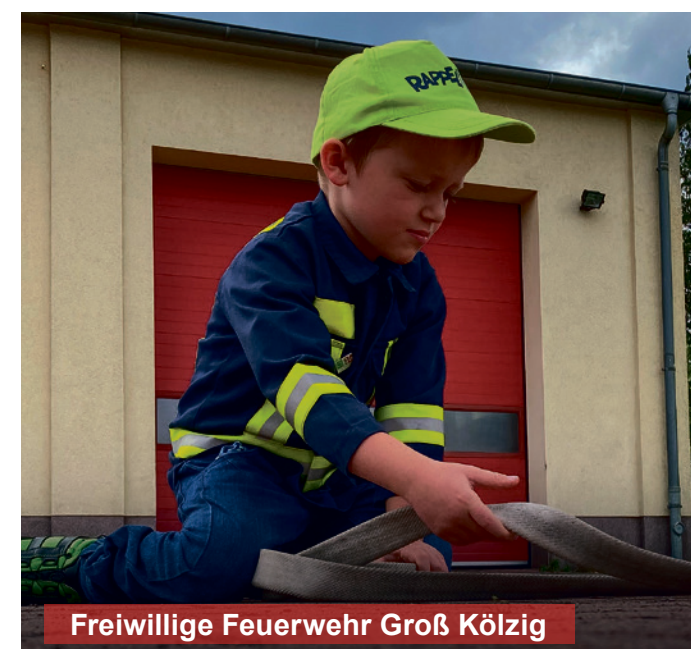
Freiwillige Feuerwehr Groß Kötzig