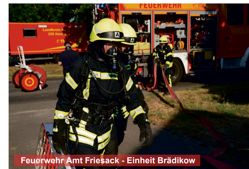
Feuerwehr Amt Friesack - Einheit Brädikow