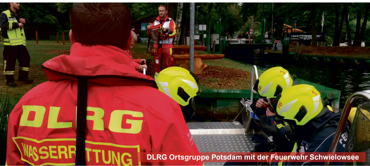
DLRG Ortsgruppe Potsdam mit der Feuerwehr Schwielowsee