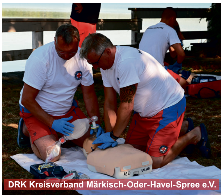
DRK Kreisverband Märkisch-Oder-Havel-Spree e.V.