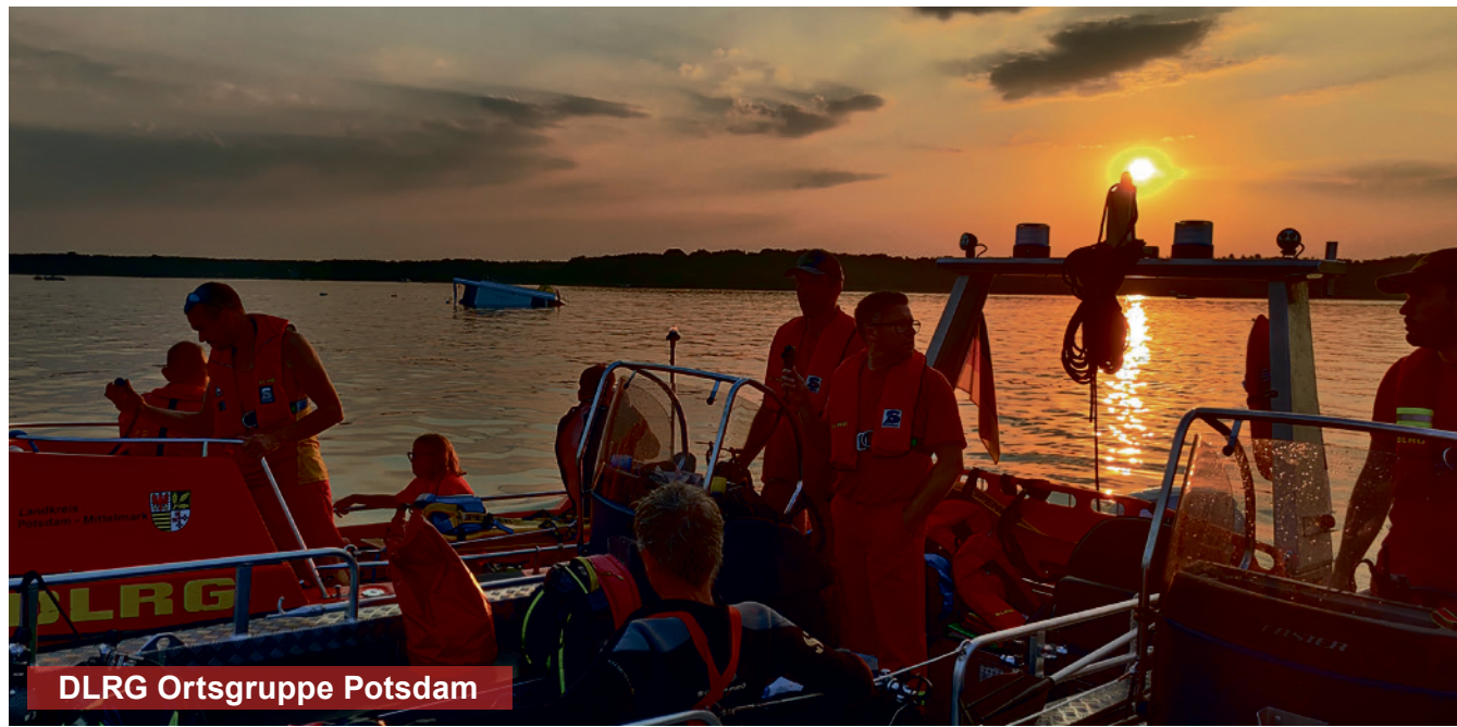
DLRG Ortsgruppe Potsdam