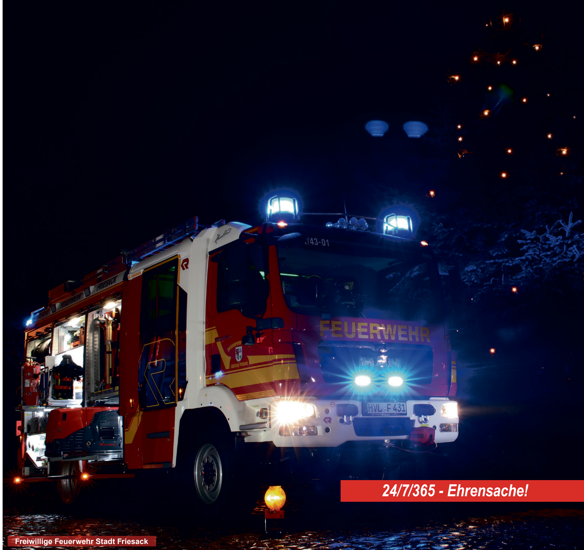
Freiwillige Feuerwehr Stadt Friesack