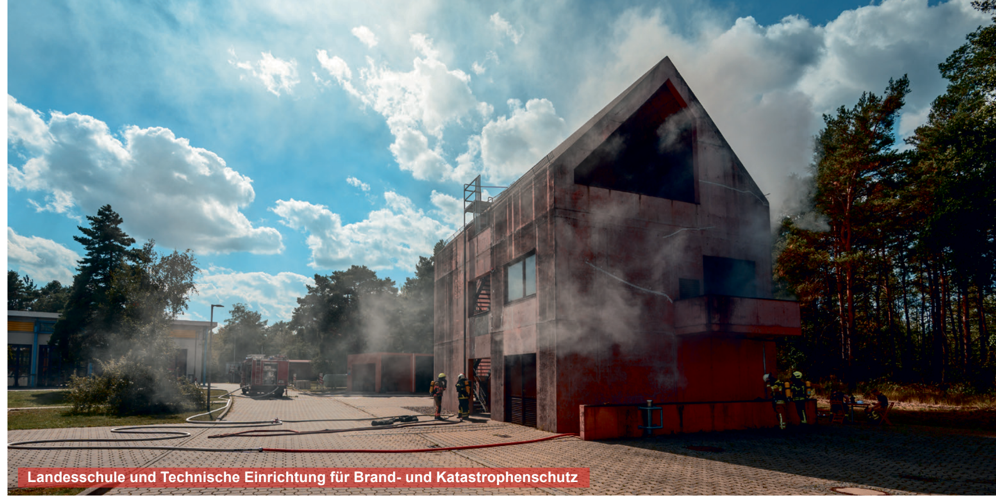
Landesschule und Technische Einrichtung für Brand- und Katastrophenschutz