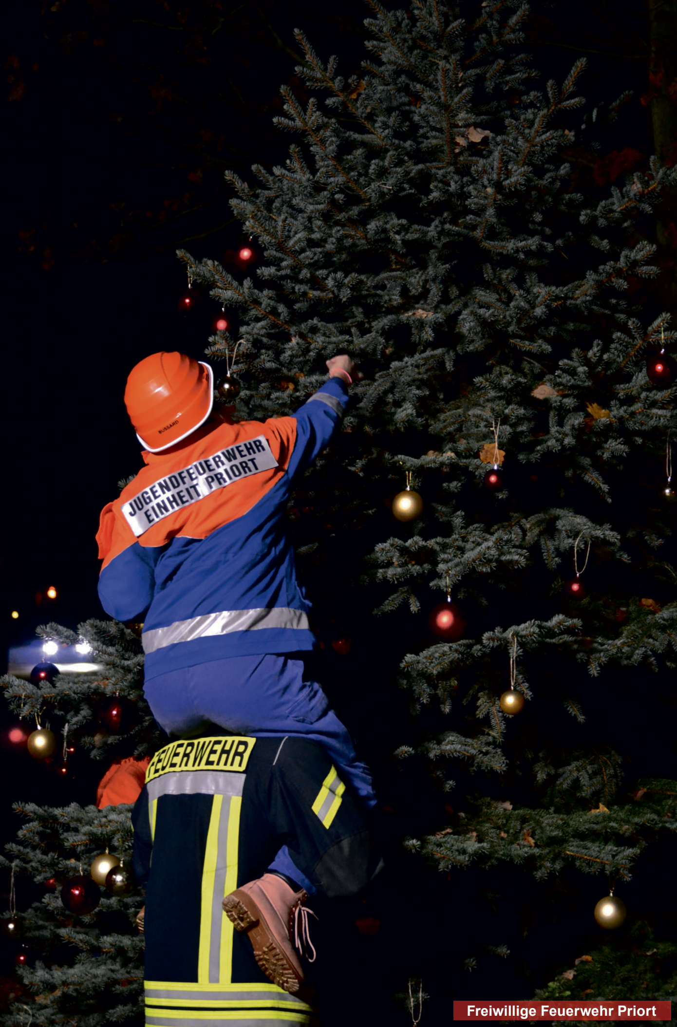
Freiwillige Feuerwehr Priort