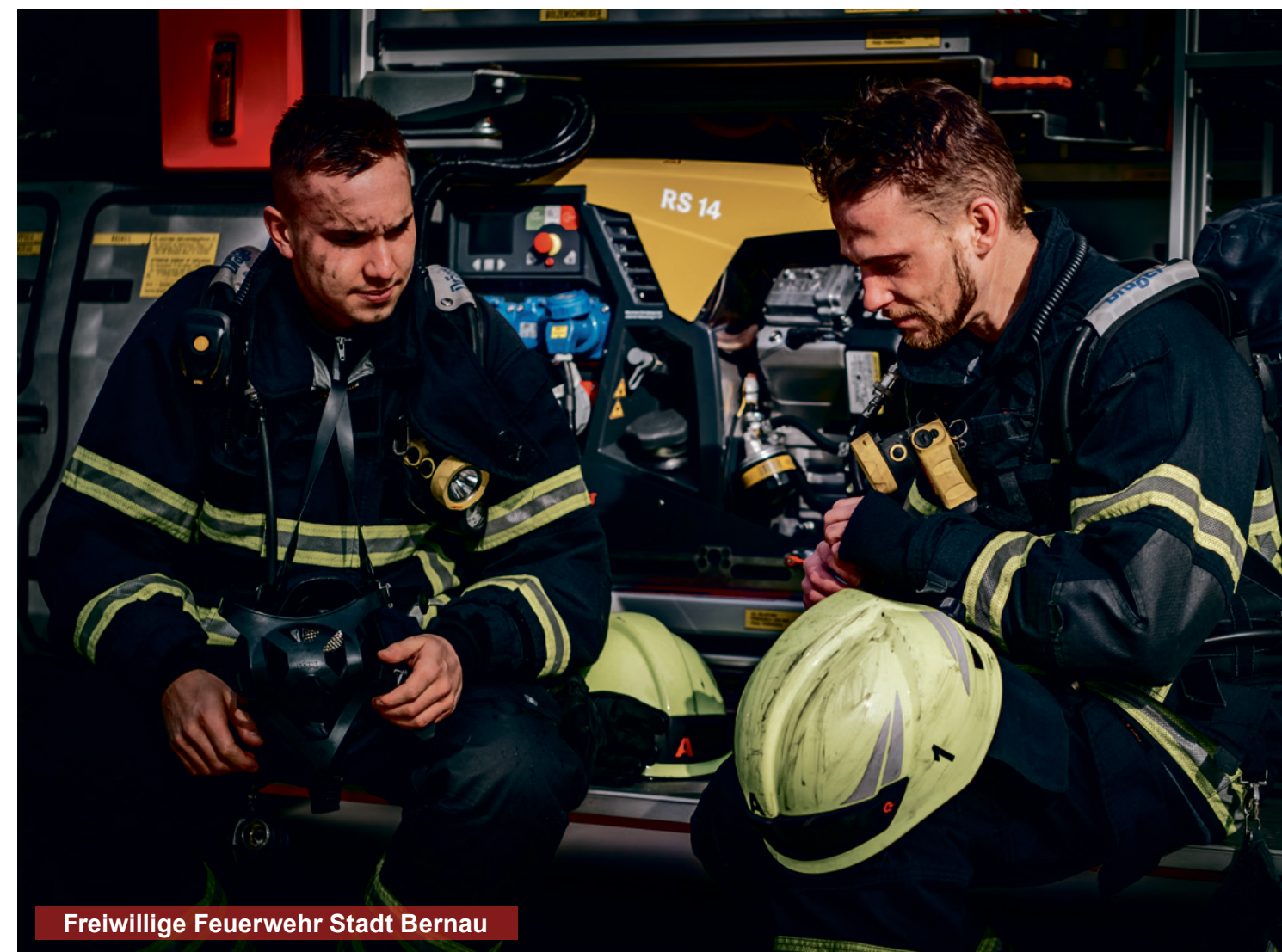
Freiwillige Feuerwehr Stadt Bernau