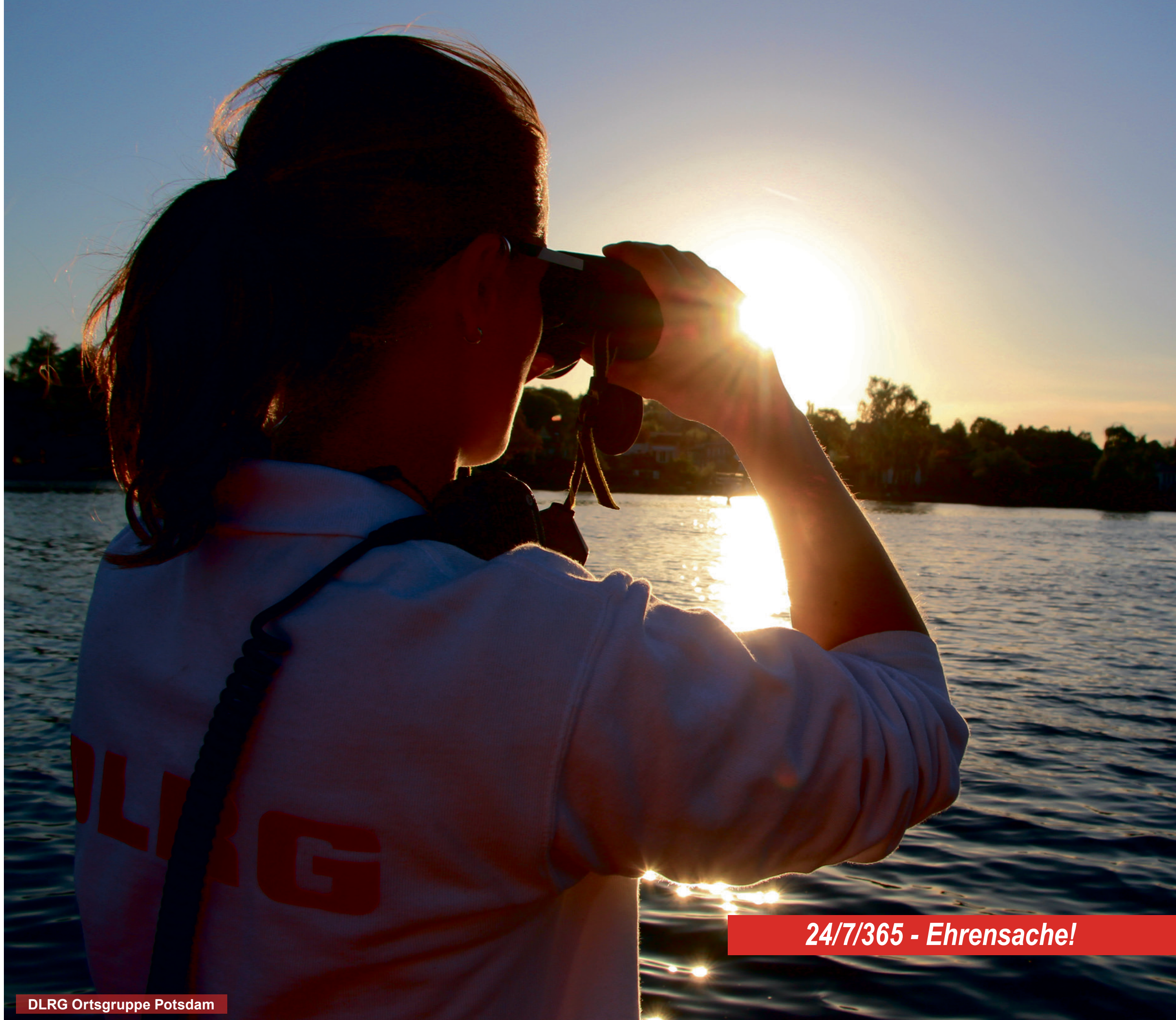
DLRG Ortsgruppe Potsdam