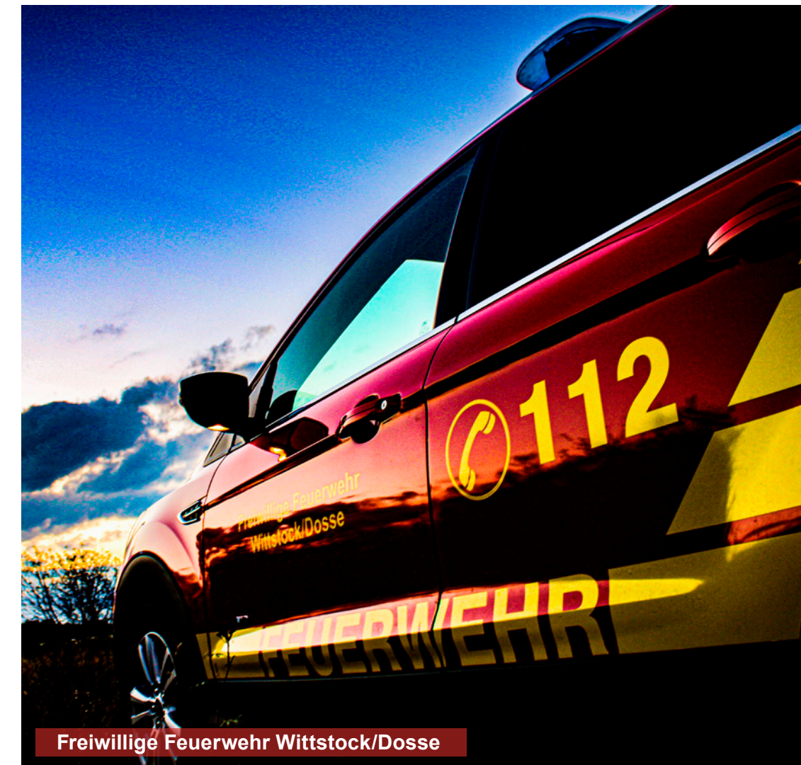
Freiwillige Feuerwehr Wittstock/Dosse