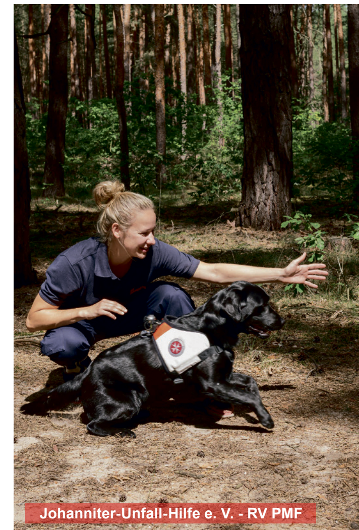
Johanniter-Unfall-Hilfe e. V. - RV PMF