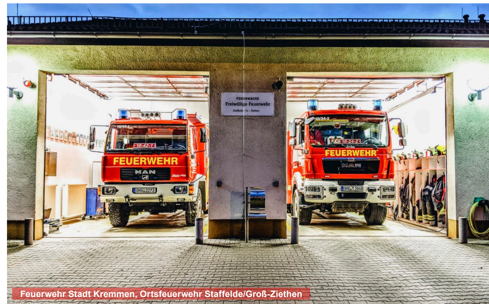
Feuerwehr Stadt Kremmen, Ortsfeuerwehr Staffelde/Groß-Ziethen