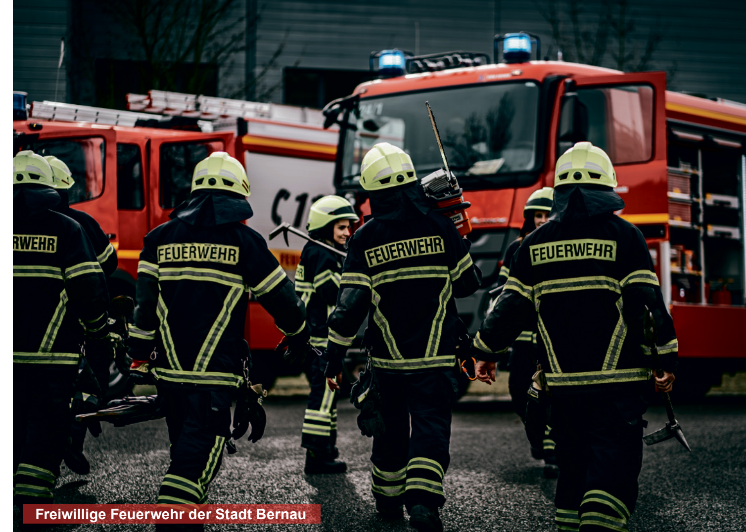
Freiwillige Feuerwehr der Stadt Bernau