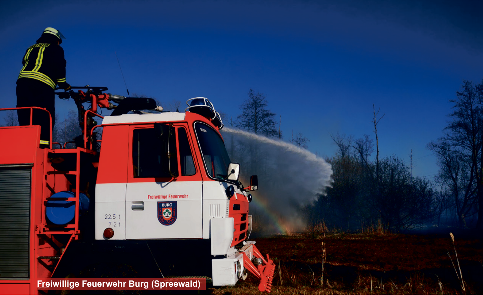
Freiwillige Feuerwehr Burg (Spreewald)