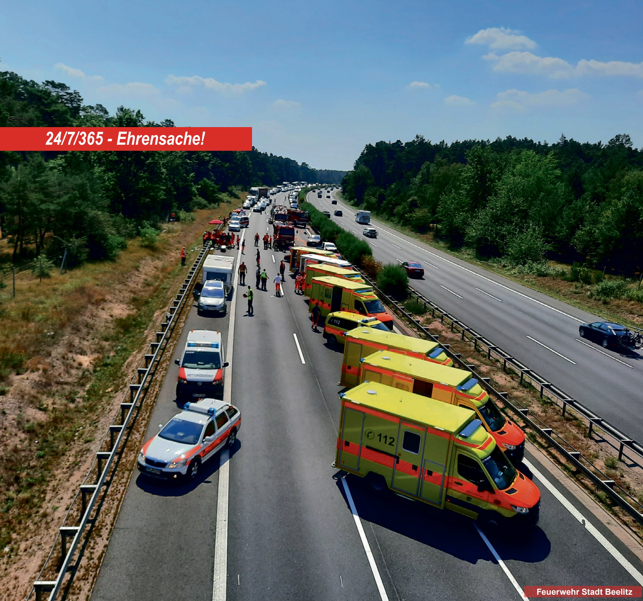
Feuerwehr Stadt Beelitz