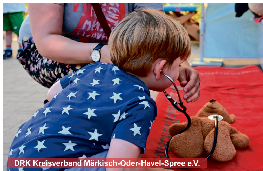
DRK Kreisverband Märkisch-Oder-Havel-Spree e.V.