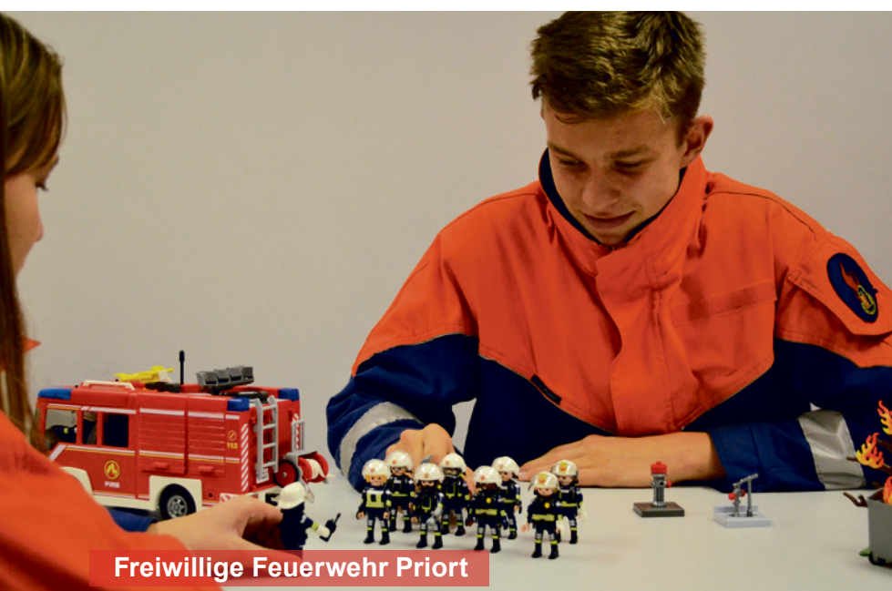
Freiwillige Feuerwehr Priort