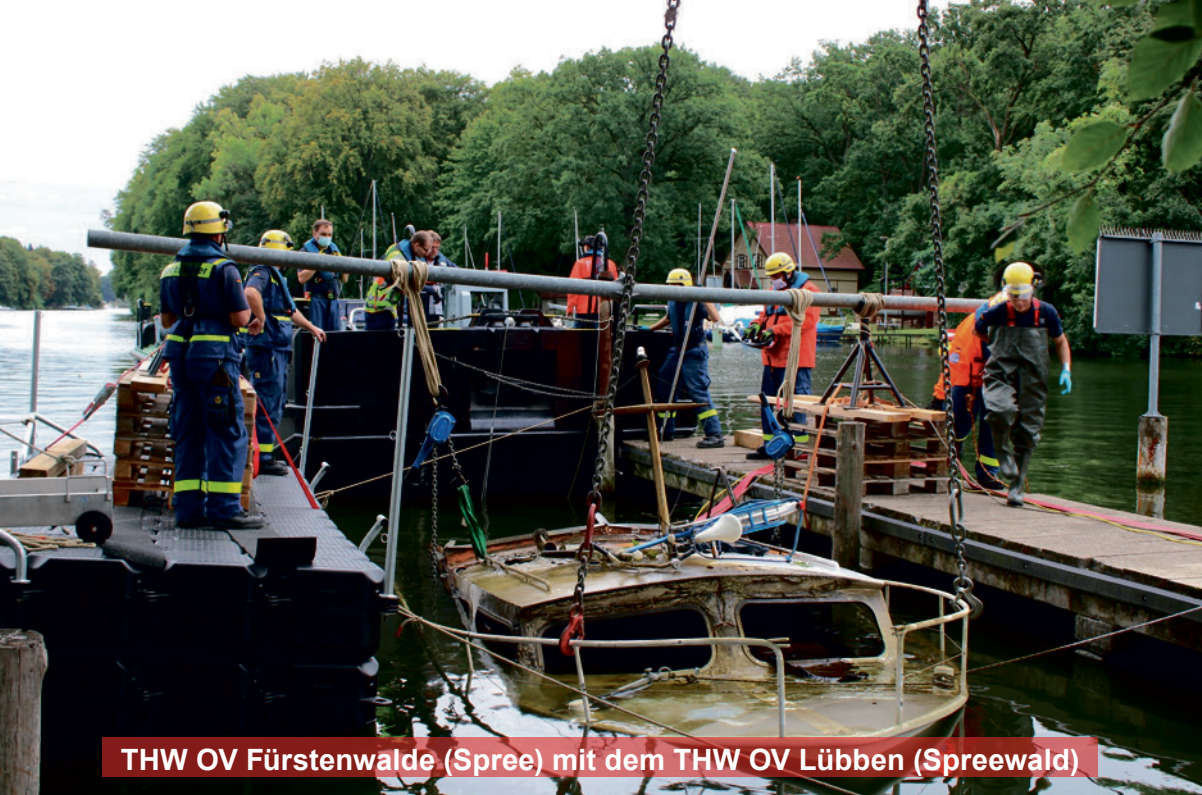
THW OV Fürstenwalde (Spree) mit dem THW OV Lübben (Spreewald)