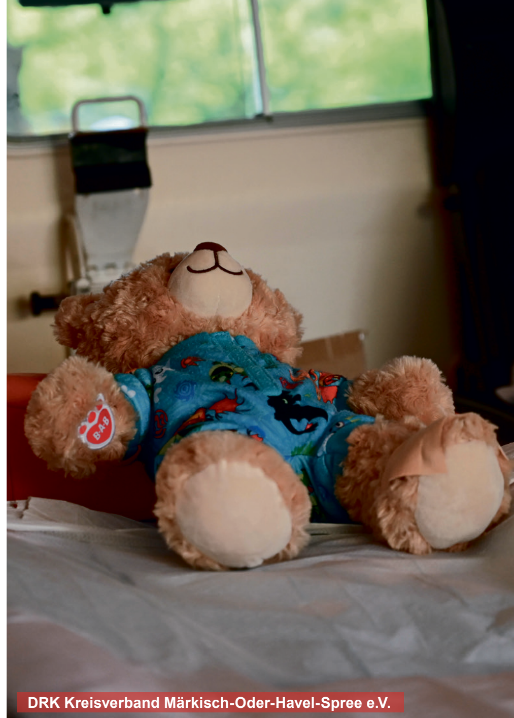
DRK Kreisverband Märkisch-Oder-Havel-Spree e.V.