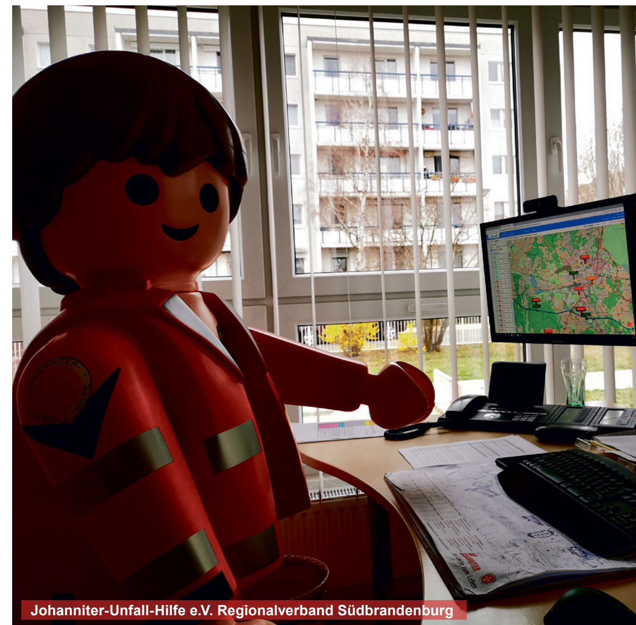
Johanniter-Unfall-Hilfe e.V. Regionalverband Südbrandenburg