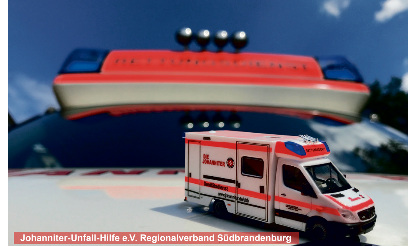
Johanniter-Unfall-Hilfe e.V. Regionalverband Südbrandenburg