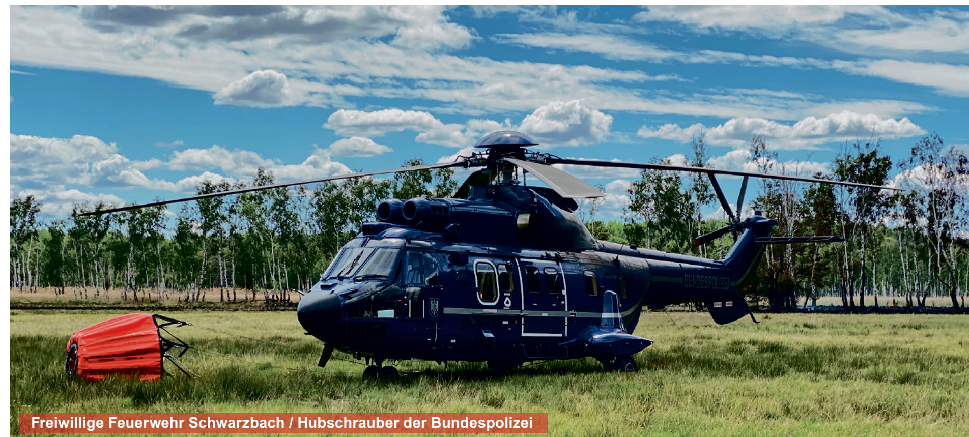
Freiwillige Feuerwehr Schwarzbach / Hubschrauber der Bundespolizei