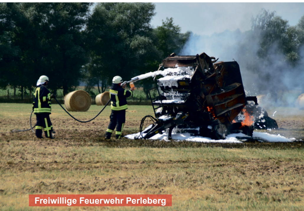
Freiwillige Feuerwehr Perleberg